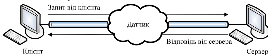
Рис. 4. Пасивний метод збору розвідувальних даних

мережі при скануванні. Незважаючи на всі переваги пасивного методу добування інформації у нього є і недоліки. Для проведення пасивного аналізу завжди потрібно інтегруватися у сегмент досліджуваного об'єкта мережі для виконання ролі датчика, через який буде проходити та аналізуватися мережевий трафік, який циркулює в цьому сегменті між об'єктами розвідки (рис. 4). Або, як варіант, потребує віддаленого з'єднання з інформаційним ресурсом досліджуваного об'єкта для генерації мережевого трафіку та його подальшого аналізу для ідентифікації віддаленого об'єкта, що в свою чергу втрачає актуальність прихованого віддаленого аналізу. Також великим недоліком є велика ймовірність помилкової ідентифікації досліджуваного об'єкта, що впливає на якісні показники добутої інформації у ході проведення розвідувальних заходів.