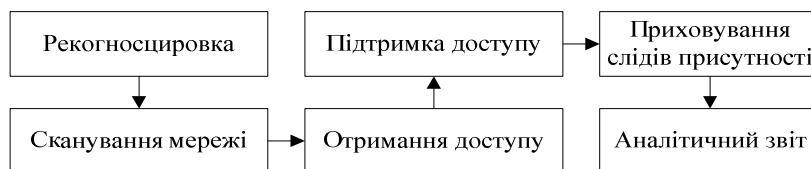
Рис. 2. Етапи проведення кібернетичної розвідки

Передумовою успішної кібернетичної атаки є розвідка кібернетичного простору противника, яка характеризується часовим та якісним критерієм добування інформації, характеристик одного або більше віддалених комп'ютерів ІТМ противника. Добування інформації може бути використаний для побудови моделі атакуючої системи та полегшення в майбутньому спроби проникнення до неї для реалізації кібернетичного впливу. Розвідку кібернетичного простору противника можна поділити на такі етапи (рис. 2):