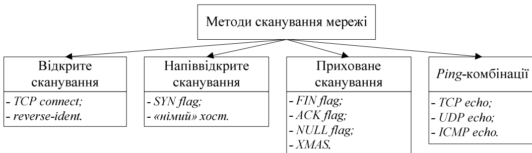
Рис. 3. Методи сканування мережі

Завчасний збір відомостей можливо співвіднести з прихованим спостереженням. На сьогодні застосовуються такі методи сканування мережі [4] (рис. 3):