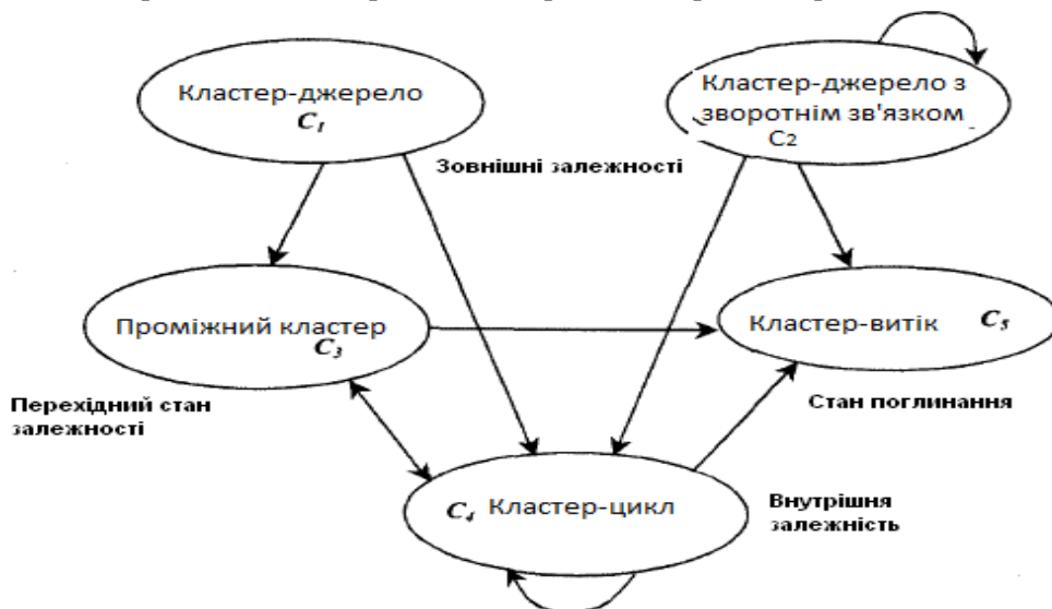
Рис. 1. Приклад мережі для вирішення задачі оцінювання

впровадження стандартів НАТО в більш тривалий термін 7-9 років.