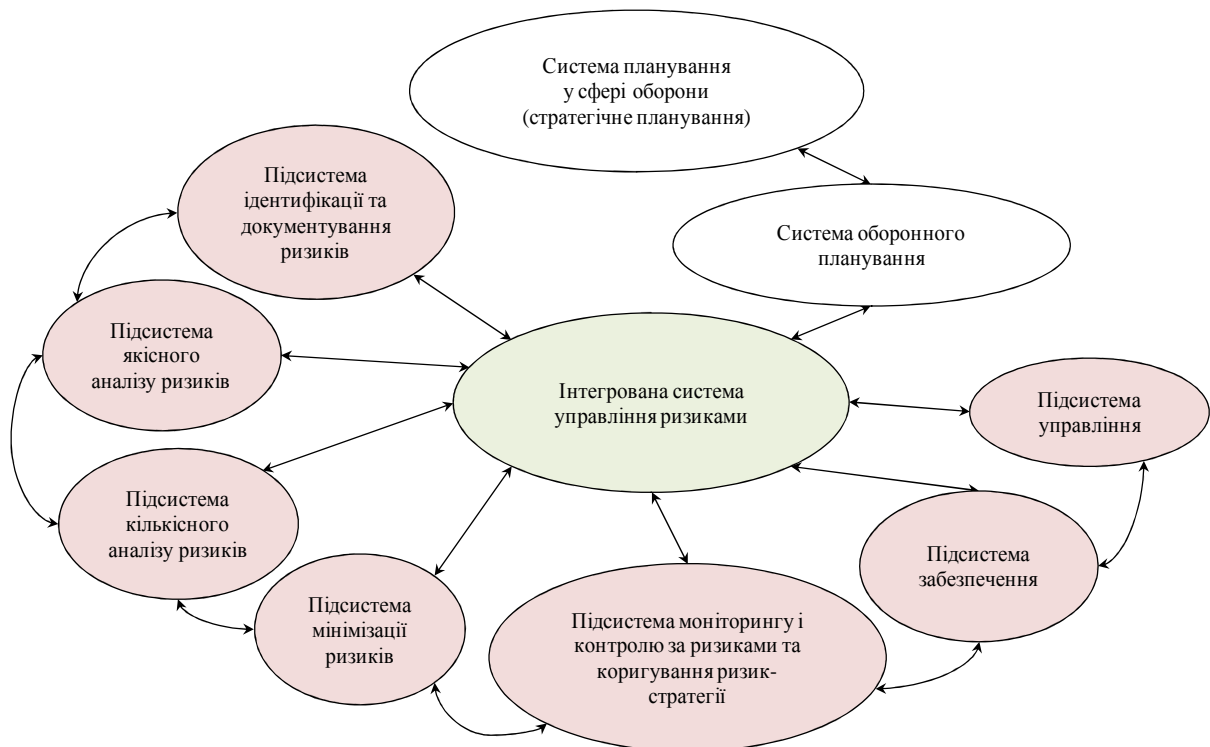
Рис. 2. Інтегрована система управління ризиками в ході оборонного планування

У загальному вигляді інтегровану систему управління ризиками в ході оборонного планування можна навести схематично (рис. 2). Система має взаємодіяти з іншими метасистемами та системами у сфері оборони через інформаційні зв'язки. На основі варіанта інтегрованої системи управління ризиками в ході оборонного планування пропонується розробити її організаційну схему функціонування.