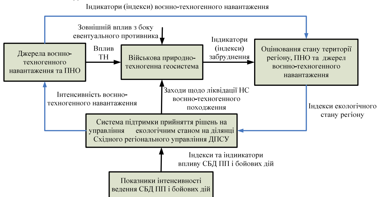
Рис. 3. Структурно-функціональна модель системи екологічного моніторингу ведення СБД ПП

Для оцінки ефективності механізмів екологічного моніторингу та державного регулювання екологічної безпеки на рівні Східного регіонального управління пропонується застосувати методи аналізу ієрархій та аналітичних мереж.