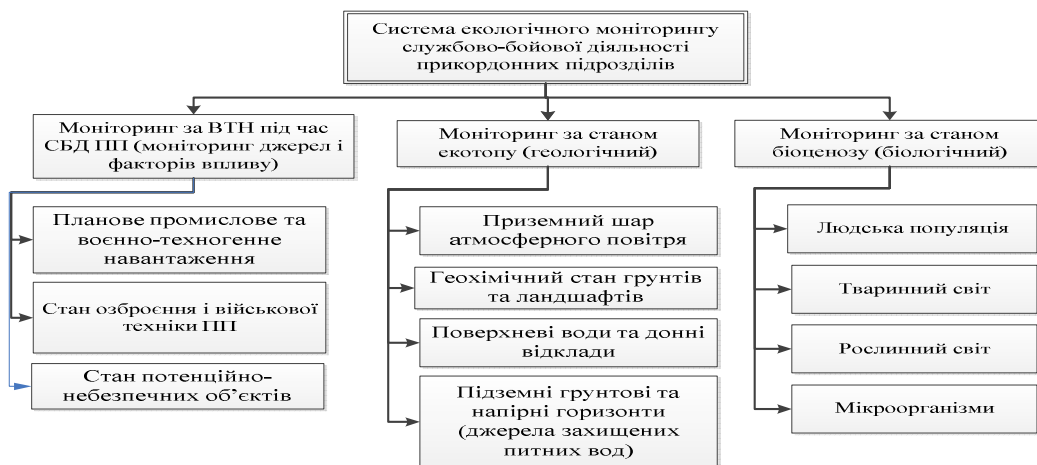
Рис. 2. Дерево системного екологічного моніторингу СБД ПП

Якщо провести декомпозицію системи екологічного моніторингу (СЕМ) СБД ПП за компонентами спостереження, що спрямоване на відтворення об'єктивної картини екологічного стану ВПТГС та ВТН, то їх систему можна представити у вигляді ієрархічного дерева (рис. 2).