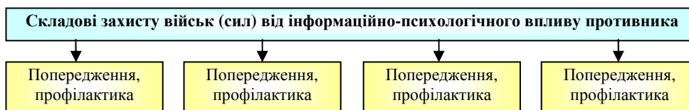
Рис. 2. Структура (складові) захисту військ від негативного ІПсВ

За своєю структурою захист військ (сил) від ІПсВ противника передбачає такі кроки: прогнозування; запобігання (попередження та профілактика); зрив (нейтралізація) та ліквідація наслідків реалізації негативного інформаційно-психологічного впливу (рис. 2, рис. 3).