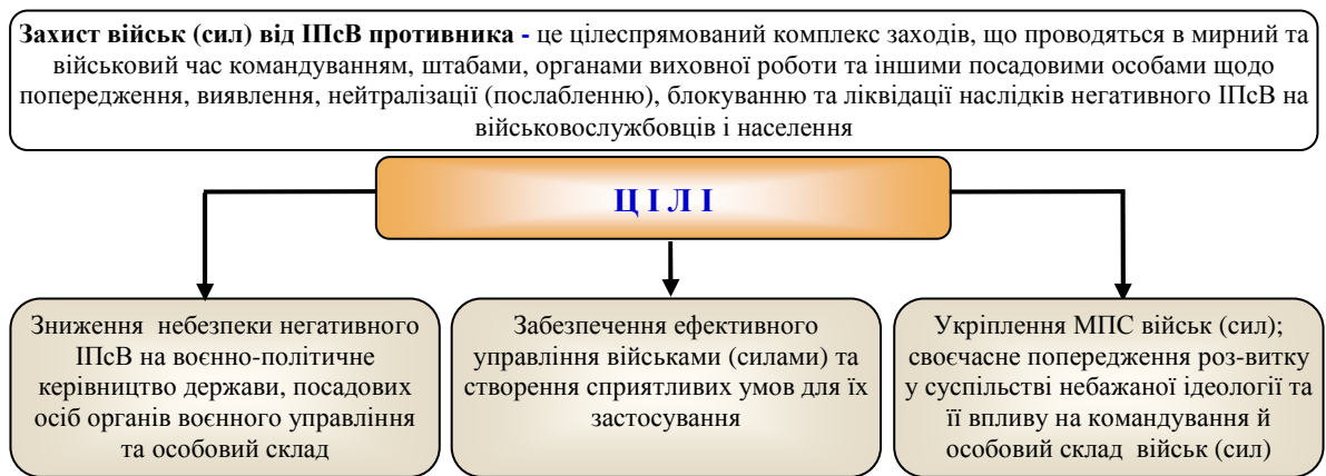
Рис. 1. Цілі захисту військ від ППСВ

своєчасного запобігання розвитку у військових колективах небажаної ідеології та її впливу на командування і особовий склад частини (підрозділу).