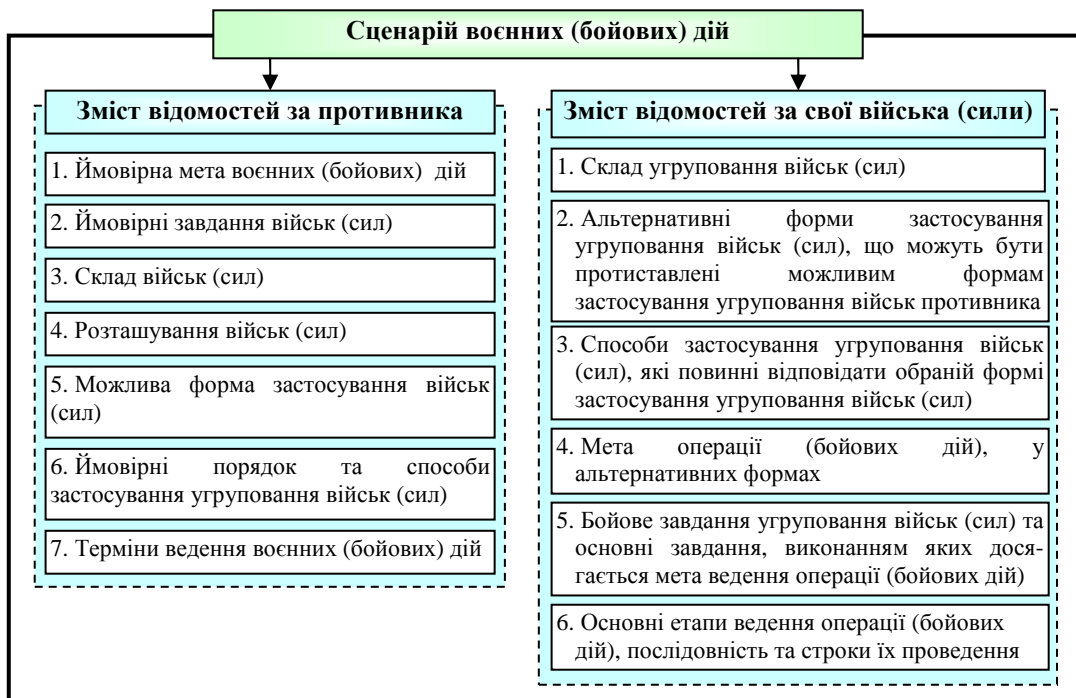
Рис. 2. Структура та зміст сценарію воєнних (бойових) дій (варіант)

уточнення бойового складу угруповання військ (сил).