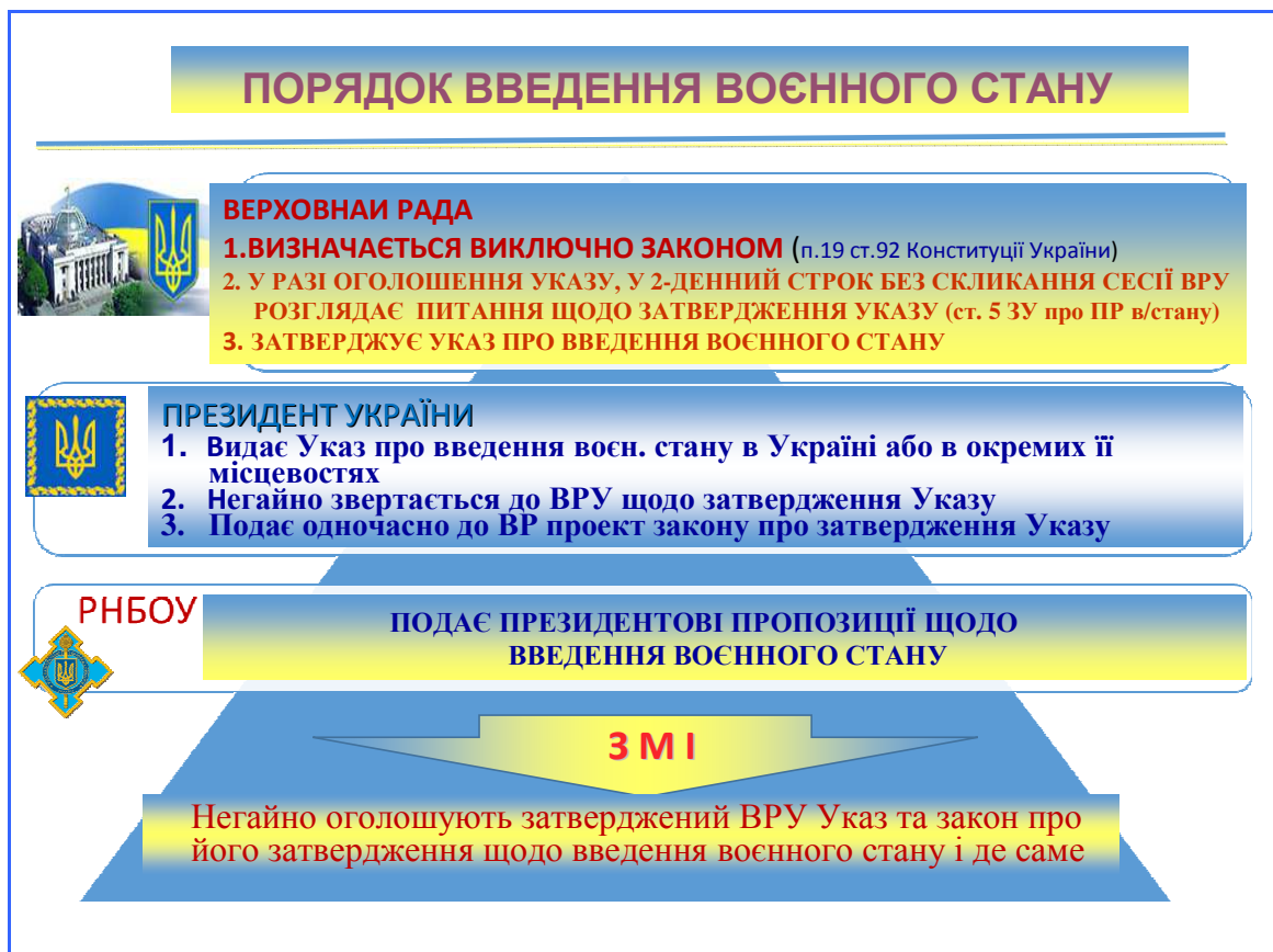
Рис. 2. Схема введення особливого правового режиму воєнного стану

“Стан війни” аж ніяк не можна плутати з “військовим станом”, тобто з особливим правовим режимом. Такий режим може бути введений в Україні або в окремих її місцевостях лише в порядку, визначеному п.19 ст. 92 Конституції України та відповідним Законом України (див. рис. 2).