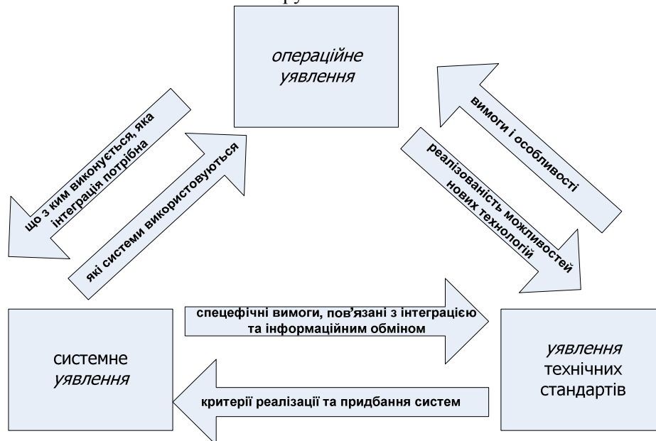
Рис. 3. Три основних уявлення, що використовуються в DoDAF

На рис. 3 наведено структуру основних уявлень, що використовуються в DoDAF. Відповідно до цієї методики розглядається три різних уявлення (операційне, системне і уявлення технічних стандартів), які у сукупності описують архітектуру. Кожне з них використовується для відображення різних архітектурних характеристик і атрибутів, хоча між ними є певні перетини. Деякі з атрибутів об'єднують два різних уявлення, що забезпечує цілісність, єдність і однаковість в описі архітектури. Вважається, що найбільш корисним описом архітектури є "інтегроване", тобто те, що поєднує різні уявлення в описі систем.