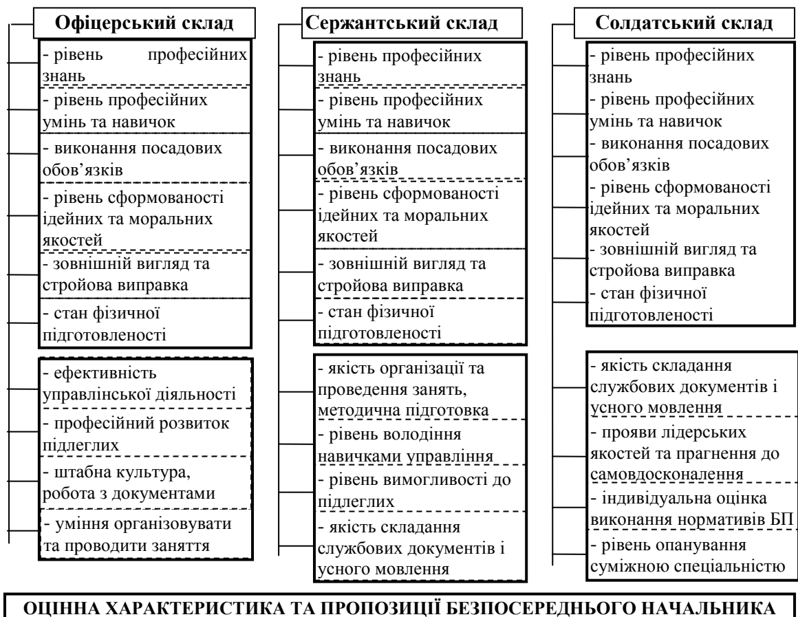
Рис. 1. Модель функціонального стану військовослужбовців

В умовах мирного життя за результатами оцінювання і атестування військовослужбовців (щорічне оцінювання, періодична атестація та незалежне оцінювання) складається оцінна картка, у другому розділі якої приводиться оцінка за критеріями службової діяльності, а в третьому – текст оцінної характеристики та пропозиції безпосереднього начальника. Таким чином, можна стверджувати, що модель функціонального стану військовослужбовців (за категоріями) для умов мирного часу вже існує. Структурно її можна подати у вигляді, наведеному на рис. 1.