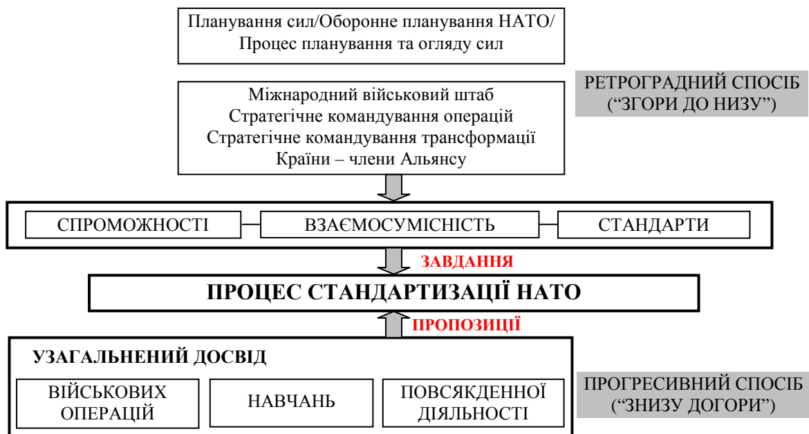
Рис. 2. Менеджмент процесу стандартизації НАТО

Менеджмент процесу стандартизації в НАТО здійснюється комбіновано, відповідно до так званого принципу зустрічного потоку: ретроградним способом – “згори до низу” і прогресивним способом – “знизу до гори” (рис. 2).