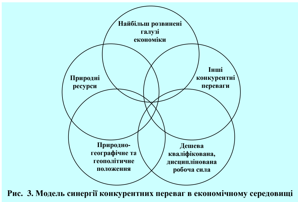
Рис. 3. Модель синергії конкурентних переваг в економічному середовищі

При розробленні мобілізаційних програм розвитку економіки пріоритетного значення слід надати програмам, направленим на взаємний розвиток науково-технічного та виробничого потенціалів країни, особливо в оборонно-промисловому комплексі, який характеризується наявністю найбільш передових технологічних досягнень, потужними науковим та виробничим потенціалами, та зовнішніми маркетинговими зв'язками.