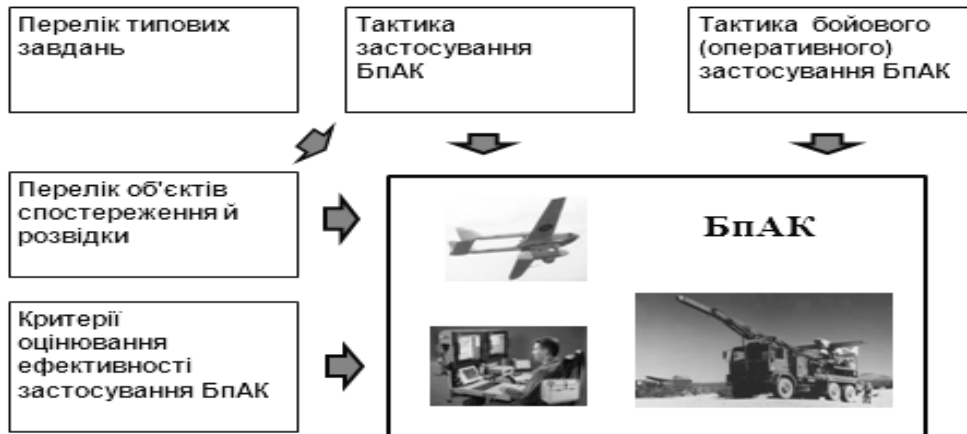
Рис. 4. Формування оперативно-тактичних вимог до БпАК