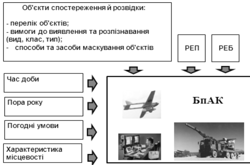
Рис. 3. Формування тактико-технічних вимог до БпАК

Розробці тактико-технічних вимог передують визначення оперативно-тактичних вимог, в яких потрібно проінсталювати весь перелік типових завдань, перелік і характеристики об'єктів розвідки та спостереження, елементи тактики бойового (оперативного) застосування БпАК, а також кількісні критерії оцінювання ефективності застосування БпАК (рис. 4).