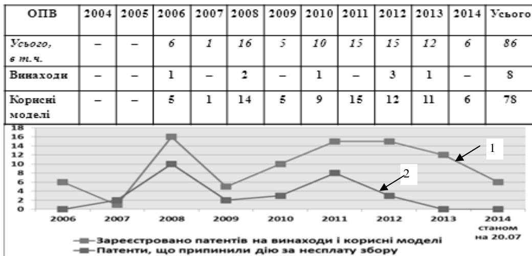
Рис. 1. Статистика щодо динаміки реєстрації патентів [5]

Враховуючи дані з відкритих засобів масової інформації, сьогодні вже має місце активізація створення та застосування БпАК в інтересах вирішення, у першу чергу, завдань розвідки та спостереження. Передбачалося за повідомленням ДК “Укроборонпром” у ЗМІ, що Збройні Сили мали отримати до кінця 2015 року на озброєння БпАК “Spectator” [6], а також у найближчій перспективі ще один безпілотник “Observer”, що знаходиться на стадії завершення розробки [7].