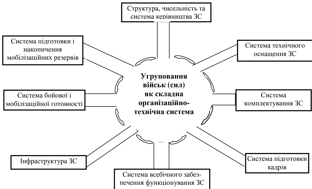
Рис. 1. Структура складових ЗС як організаційно-технічної системи (варіант)

Збройні Сили повинні бути здатними своєчасно створювати потрібні угруповання військ і здійснювати керівництво ними під час ведення бойових дій. Відповідно до наведеного вище визначення обрису ЗС їх можна розглядати як складну організаційно-технічну систему, структура складових якої наведена на рис. 1.