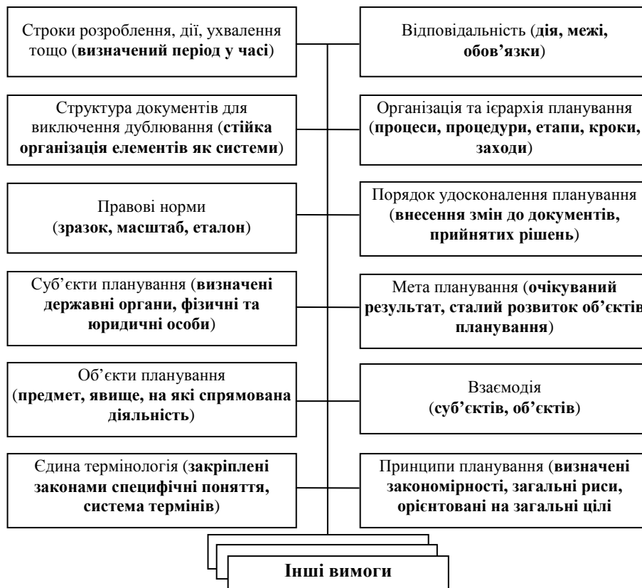
Рис. 2. Сукупність основних вимог до системи документів стратегічного планування розвитку спроможностей Збройних Сил України та інших складових сил оборони

За результатами проведеного дослідження сформовано сукупність основних вимог до системи документів СПРС ЗС України та ІССО (рис. 2).