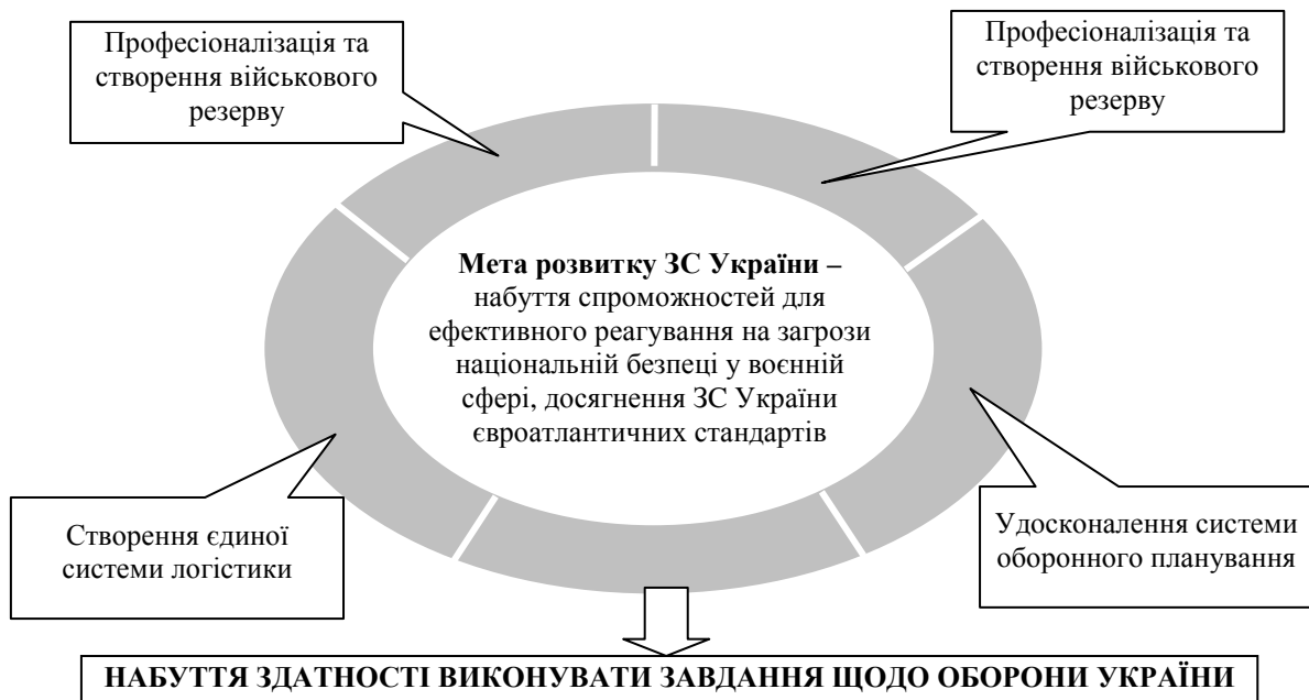
Рис. 1. Стратегічні цілі розвитку Збройних Сил України

Так, у СОБ визначено стратегічні й оперативні цілі оборонної реформи та шляхи їх досягнення. Зокрема, щодо збільшення спроможностей сил оборони до рівня, що дасть змогу забезпечити виконання завдань оборони держави і відновлення її територіальної цілісності, активізації участі в реалізації Спільної безпекової і оборонної політики Європейського Союзу та активне співробітництво з НАТО з досягненням критеріїв, необхідних для набуття повноправного членства в Організації Північноатлантичного договору [1]. Однією з представлених у СОБ стратегічних цілей розвитку Збройних Сил України, наведених на рис. 1, є “Професіоналізація та створення необхідного військового резерву ЗСУ”.