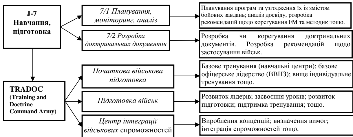
Рис. 1 Структура управління підготовкою Сухопутних військ за стандартами НАТО

До секції Головного штабу СВ США J-7 входять два відділи – планування і моніторингу та аналізу результатів підготовки та застосування військ та відділ розробки доктринальних документів.