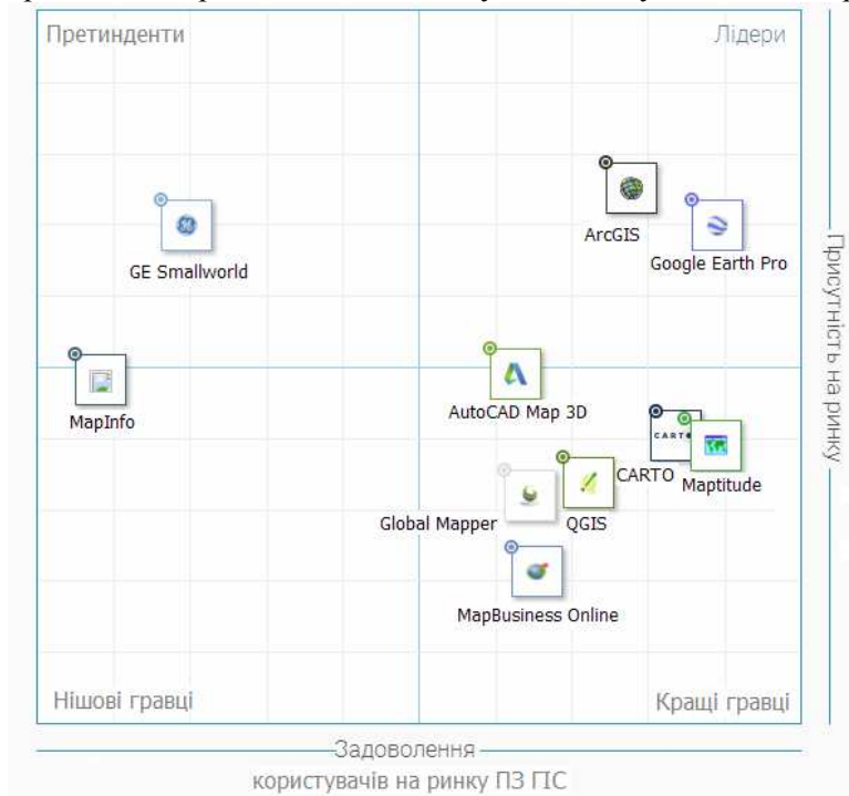
Рис. 2. Квадрант ринку загальний для усіх сегментів ГІС-продуктів (за даними агентства G2 Crowd за 2017 рік)

квадранті виробників ГІС-технологій (рис. 2) провідне місце посідає програмний продукт ArcGIS компанії ESRI (США). Присутність програмних продуктів у кожному з квадратів обумовлений умовами відбору [5].