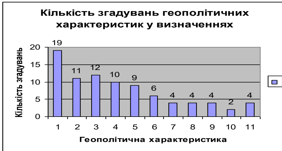
Рис. 1. Кількість згадувань геополітичних характеристик у визначеннях

Х. Моргентау, визначаючи національну силу держави, виокремив дев'ять характеристик: географічне положення, природні ресурси, промислові можливості, військова підготовленість, чисельність населення, національний характер, національна мораль, якість дипломатії, якість уряду.