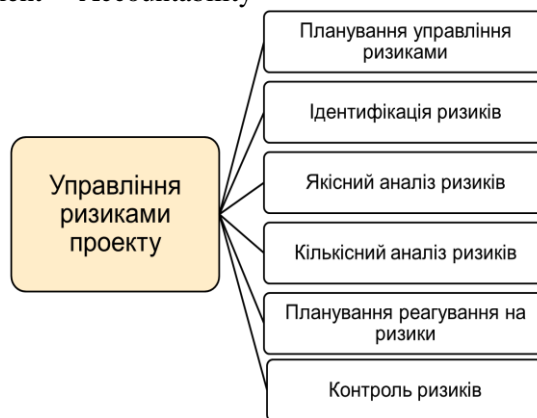
Рис. 1. Управління ризиками проекту

Виклад основного матеріалу. Управління ризиками проекту включає процеси, пов'язані з проведенням планування, ідентифікації, аналізу, реакцій, моніторингу і контролю управління ризиками проекту (рис. 1). Більшість цих процесів оновлюється під час проекту.