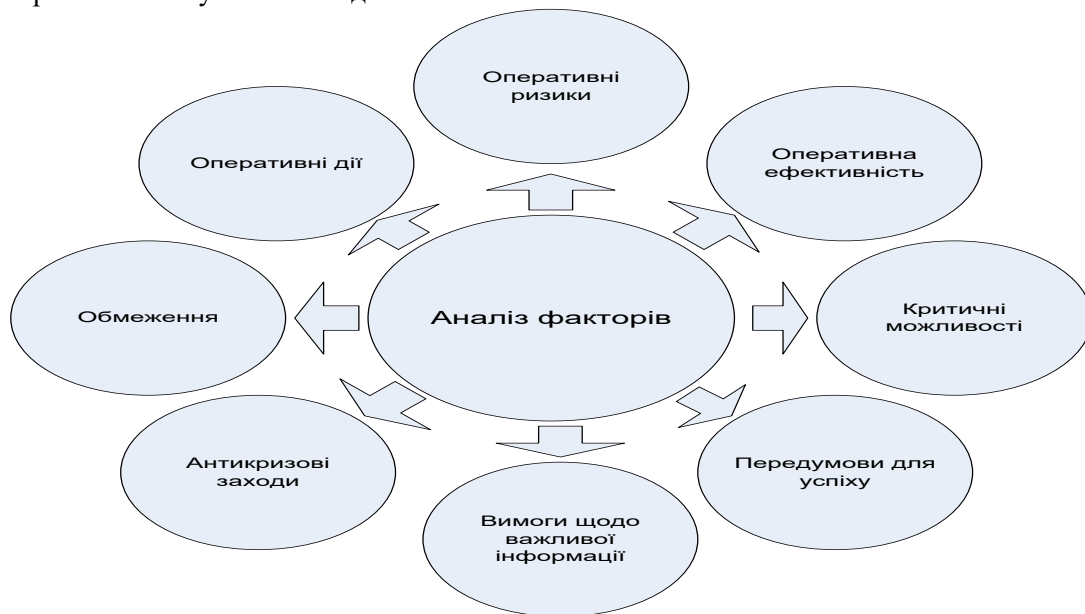
Рис. 3. Аналіз факторів при плануванні.

Оцінювання оперативної обстановки є під час операції. Оцінювання проводиться штабами всіх рівнів і включає вивчення безлічі об'єктивних і суб'єктивних факторів (рис. 2).