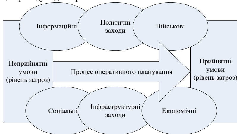
Рис.1. Підхід до оперативного планування за стандартами НАТО.

інших заходів в інтересах застосування до прийнятних умов (рівнів загроз) для збройних сил з метою реагування на існуючі або потенційні загрози, кризові ситуації та воєнні конфлікти, переходу від неприйнятних