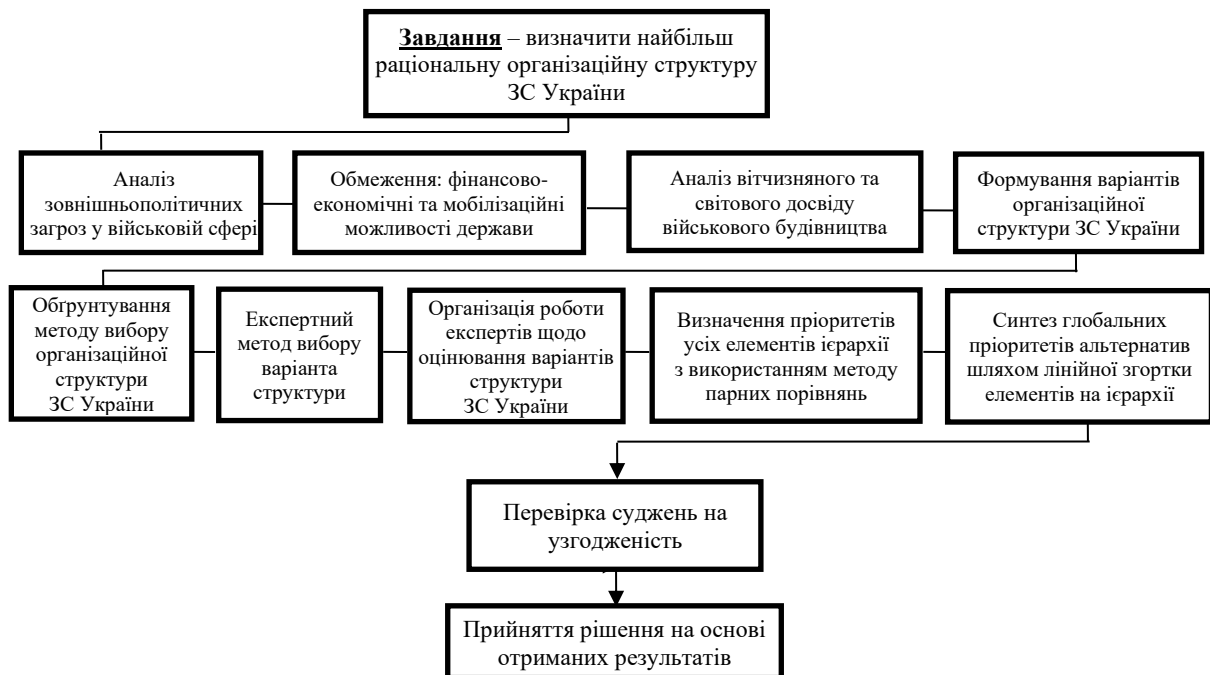
Рис. 1. Структурно-логічна схема визначення організаційної структури ЗС України

Водночас, система управління військами (силами), відповідно до принципів НАТО, залишається незмінною як у мирний, так і у воєнний час, незалежно від організаційної структури ЗС України (рис. 1).