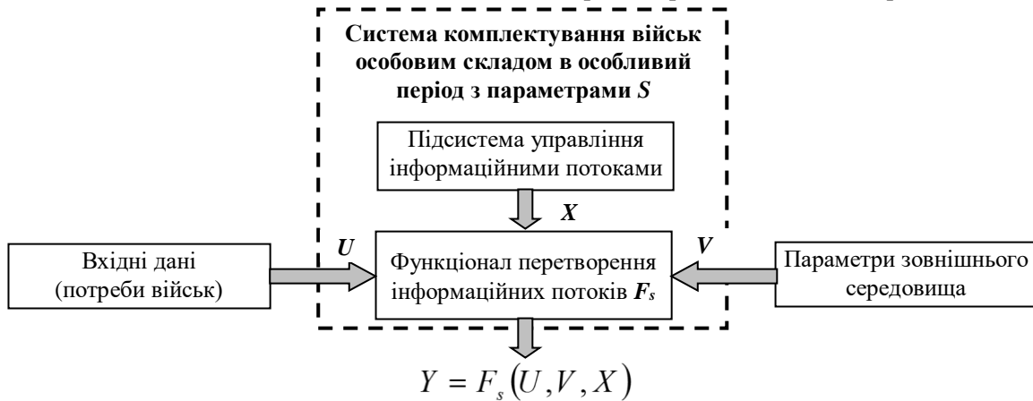
Рис. 1. Загальна функціональна схема перетворення інформаційних потоків у системі кадрових органів

Загальну функціональну схему перетворень інформаційних потоків системи кадрових органів наведено на рис. 1.