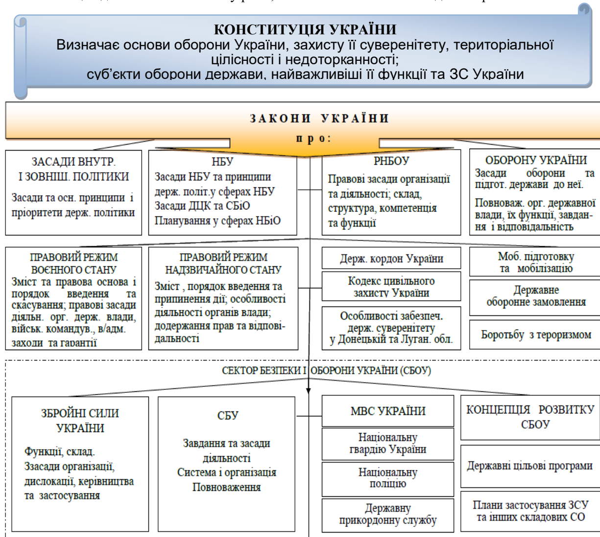
Рис. 1. Основні концептуальні нормативно-правові акти у сфері оборони

Спираючись на описану методологію, в оборонній сфері нині є потреба розробити або вибрати чи сформувати окрему модель, насамперед, для імплементації чинного законодавства, передусім концептуальних нормативно-правових актів для стратегічного та оборонного планування. Їх, як стверджують фахівці, налічується понад шести десятків [9]. Основні з них наведені на рис. 1.