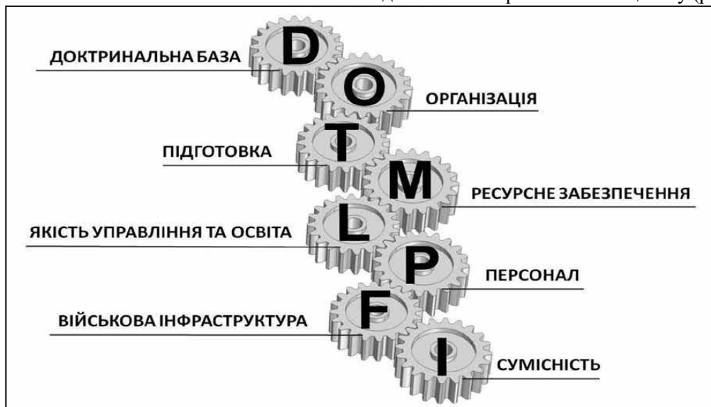
Рис. 1. Базові складові спроможності (DOTMLPFI)

Автори [10] виклали підходи до можливої імплементації норм чинного Закону України “Про національну безпеку України”, пов’язані з формуванням сучасної системи оборонного планування та розвитку сектору безпеки і оборони, розробленням довго- та середньострокових документів стратегічного та оборонного планування розвитку військ (сил) на основі спроможності за базовими складовими DOTMLPFI, яка широко застосовується в арміях держав – членів НАТО. Серед них наказом Міністерства оборони України від 22.12.2020 № 484 визначені доктринальна база, організація, підготовка, ресурсне забезпечення, якість управління та освіта, персонал, військова інфраструктура, взаємосумісність, які у сукупності є визначальними для утворення та досягнення спроможності в цілому (рис. 1).