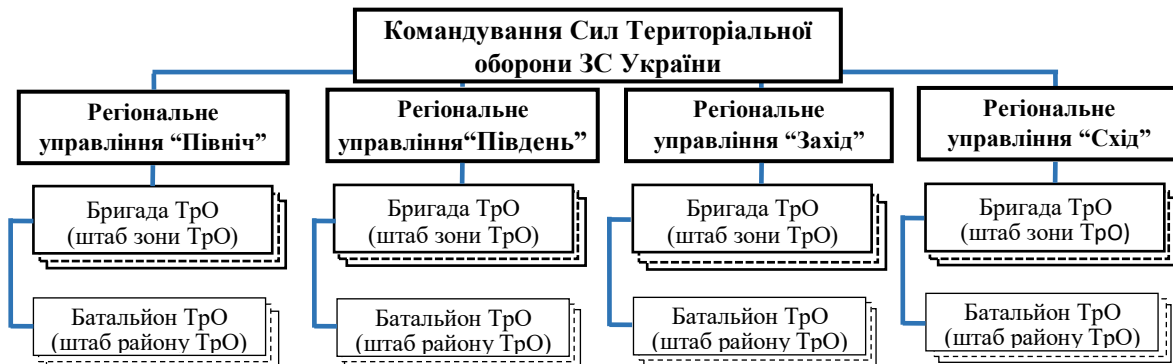
Рис. 2. Організаційна структура Сил територіальної оборони Збройних Сил України

Законодавством України визначено організаційну структуру СТрО (рис. 2), та порядок їх формування. Одним із принципів, на яких ґрунтується територіальна оборона є територіальність, яка передбачає формування бригади та батальйону СТрО в межах адміністративного поділу України, а органів військового управління – у межах військово-адміністративного поділу України. Тобто бригада СТрО як форма організації створюється в зоні ТрО, яка відповідає адміністративній одиниці області, а батальйон СТрО – адміністративній одиниці району в межах області [6].