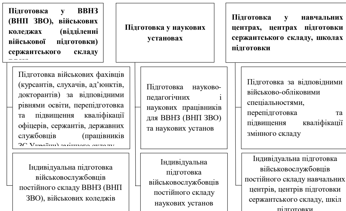
Рис. 2. Складові частини підготовки персоналу

Складові частини підготовки персоналу наведені на рис. 2.