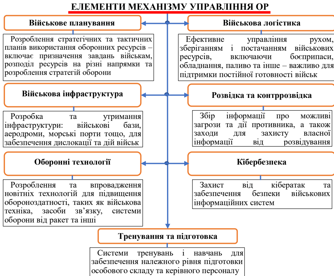
Рис. 2. Основні елементи механізму управління оборонними ресурсами

Ці елементи об'єднуються для забезпечення повного циклу оборони та готовності до реагування на можливі загрози та конфлікти.