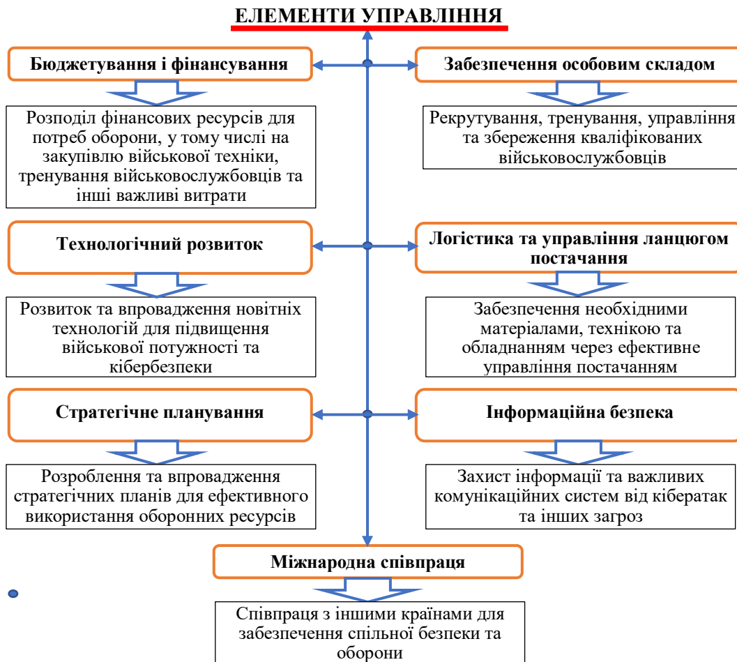
Рис. 1. Основні елементи управління оборонними ресурсами

Зазначимо, що управління оборонними ресурсами включає в себе координацію, планування та ефективне використання різноманітних ресурсів, необхідних для забезпечення національної безпеки та військової готовності країни. Це важливий аспект державного управління, спрямований на забезпечення оборони, захисту території, національної інфраструктури та інтересів країни в цілому. Складові управління оборонними ресурсами наведені на рис. 1.