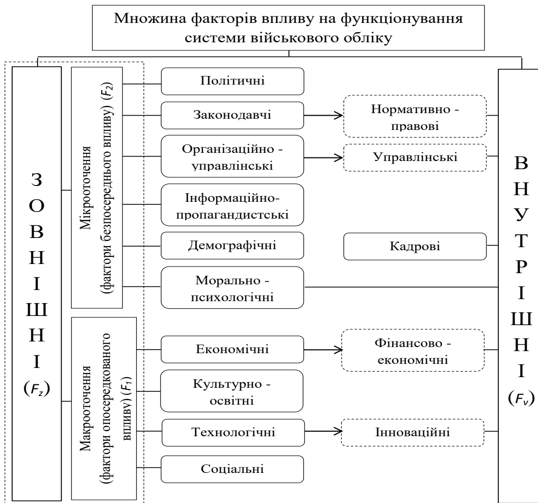
Рис. 2. Класифікація факторів, які впливають на функціонування системи військового обліку

Соціальні – це фактори, які визначаються соціальною політикою держави, рівнем соціальної захищеності громадян, рівнем життя населення (реальна заробітна плата, вартість споживчого кошика), соціальною напругою в суспільстві, диференціацією суспільства за рівнем доходів.