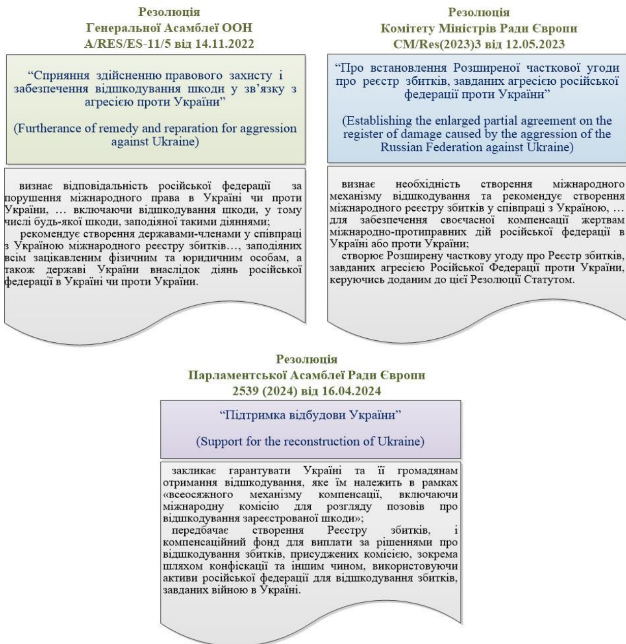
Рис. 1. Резолюції міжнародних організацій з питань відшкодування збитків, спричинених збройною агресією РФ

часткової угоди про реєстр збитків, завданих агресією РФ проти України” (Establishing the enlarged partial agreement on the register of damage caused by the aggression of the Russian Federation against Ukraine) [11] та Парламентською Асамблеєю Ради Європи 2539 (2024) від 16 квітня 2024 року “Підтримка відбудови України” (Support for the reconstruction of Ukraine) [12] (рис. 1).