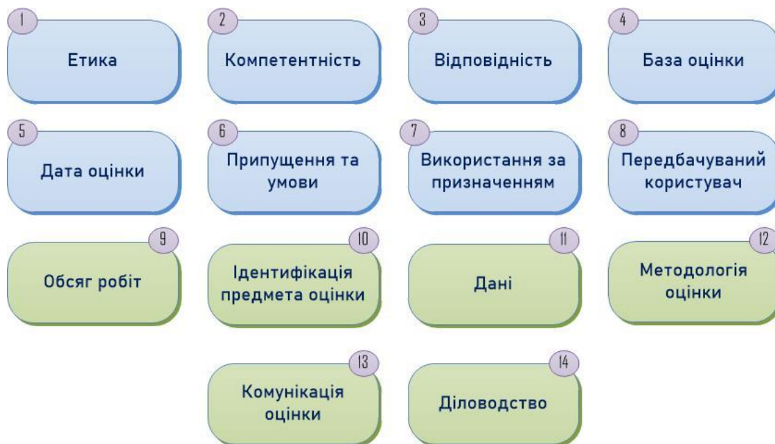
Рис. 2. Базові принципи оцінки

IVS ґрунтуються на 14 базових принципах оцінки (рис. 2) [13]: